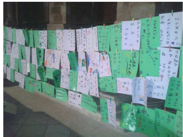
Deixa la teva empremta