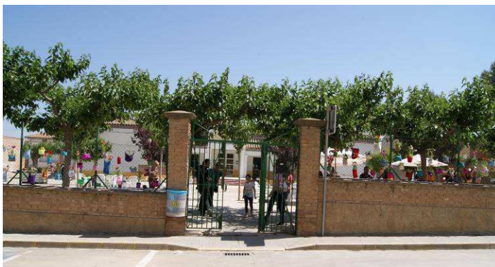
Jardí Vertical a càrrec de la Guerrilla del Gilda