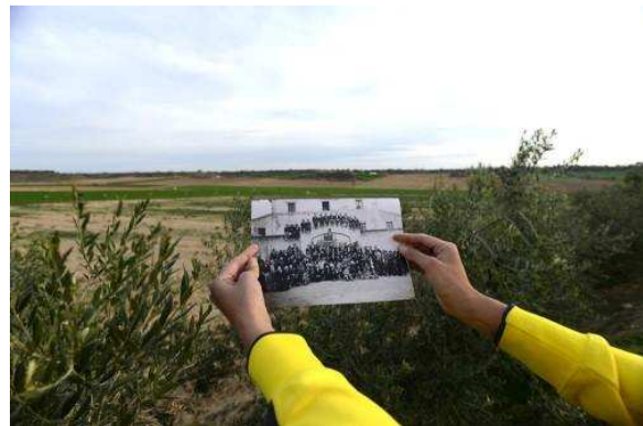
Gimeneles. Memòria colonizada