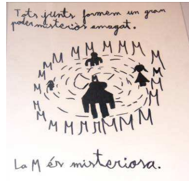
Projectes realitzats per l'escola La Creu de Torrefarrera