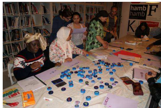
Grup de lectoescriptura de català. Treball de barris