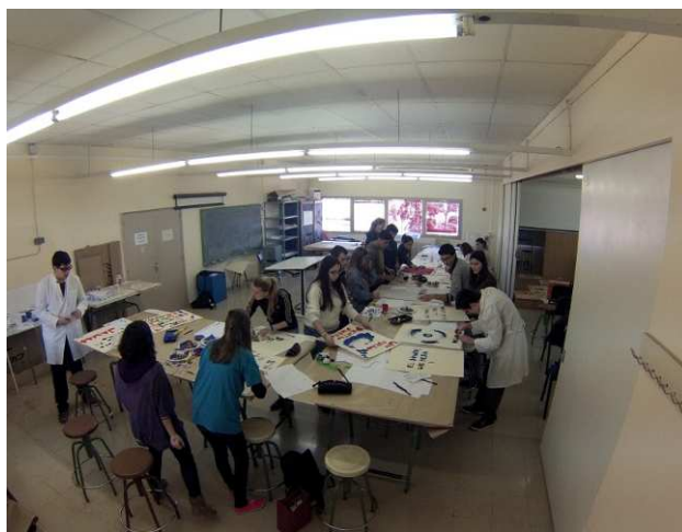
Taller de tipografia modular