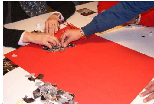
Grup de La Iorxa