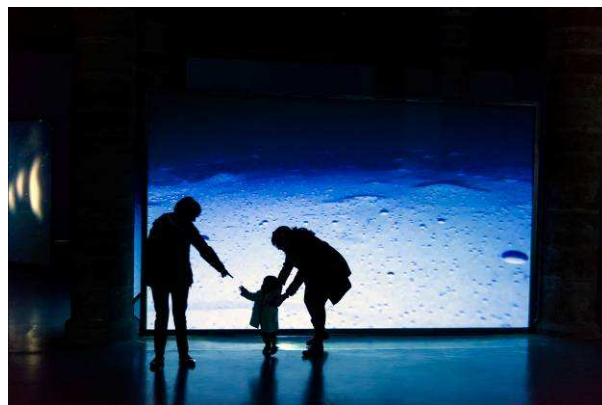
Els més petits visiten La Panera.