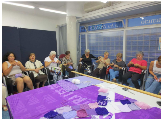
Taller Labors per la Igualtat