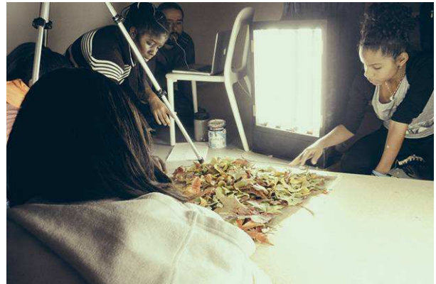
EMOCIONS . Taller d'animació i gènere femení