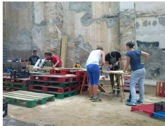
Projecte El Pati Obert