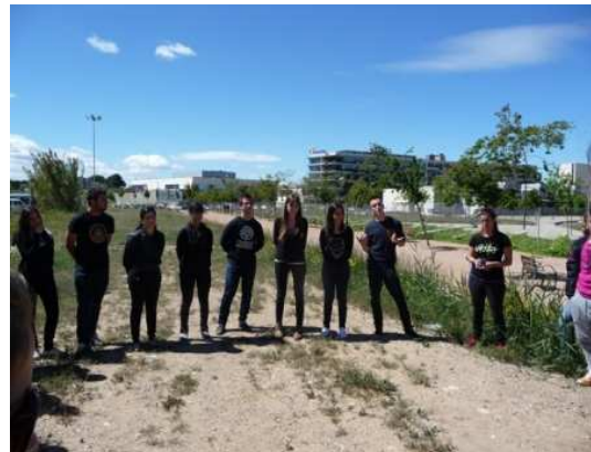
Alumnes de la Facultat de Ciències de l'Educació. Grau d'Educació Primària Bilingüe, 2n curs.