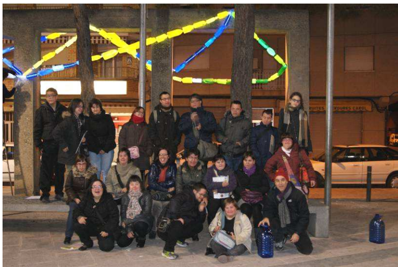
Participants del projecte Llums (de Nadal) per a ser vistos

El projecte Llums (de Nadal) per a ser vistos s'emmarca dins la convocatòria del programa d'Art per a la Millora Social de l'Obra Social "la Caixa".