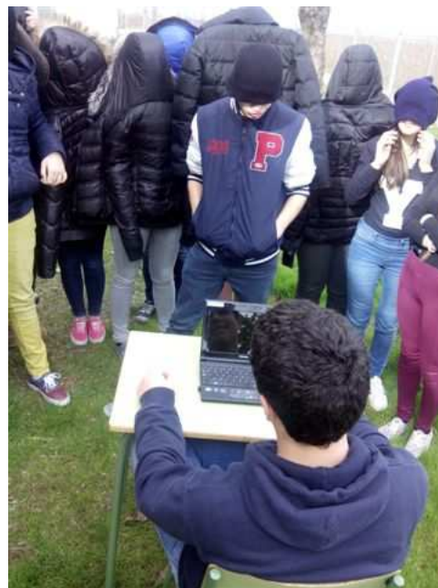
Seminari: XARXES SOCIALS, Entre l'espai públic i l'espai privat