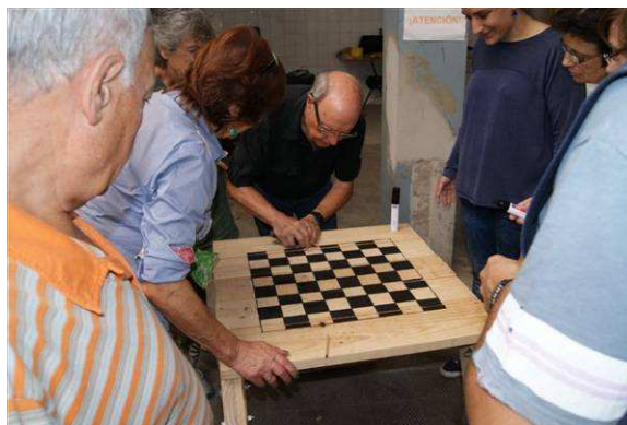
Taller a càrrec de Todo por la praxis