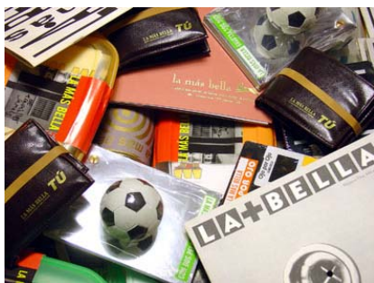
La Más Bella