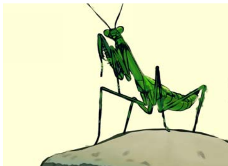
Mantis , 2003