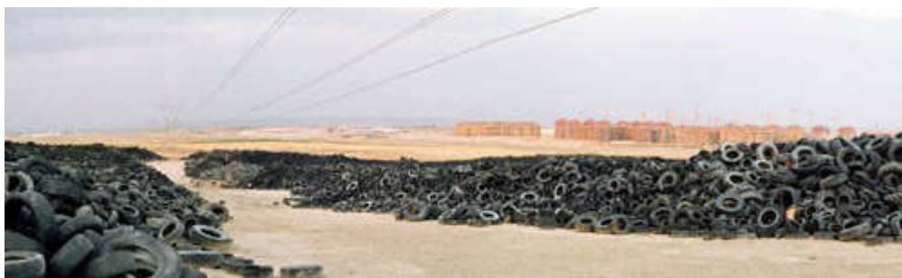
Basurama, Cementerio de neumáticos. Seseña (Toledo)

Basurama mostra, en una sèrie de fotografies i vídeos, diferents exemples d'aquestes situacions urbanes i algunes de les seves conseqüències. Com que es poden contemplar simultàniament, és possible apreciar com totes elles formen part del mateix mecanisme de generació i transformació de deixalles: com les actuacions urbanístiques presentades, pretesament concebudes per als ciutadans, funcionen despòticament i s'obliden de l'habitant de les ciutats, tot afavorint amb el seu disseny un model d'ocupació del territori que suposa, a la pràctica, una degradació de la ciutat consolidada.