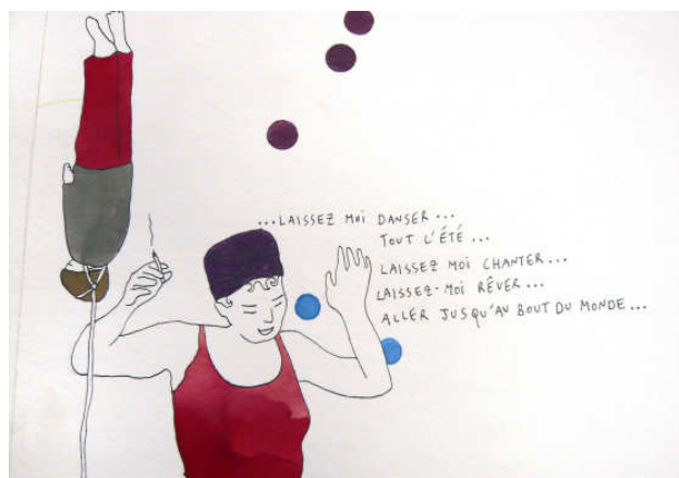
Pauline Fondevila, Viaje a Gijón II , 2006