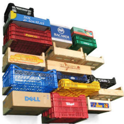
Curro Claret, Calaixera , 2003

Amb els anys, progressivament, hem vist com alguns dissenyadors s'han allunyat de l'utilitarisme i la funcionalitat que es pressuposa a aquesta disciplina, i s'han relacionat amb gran facilitat amb les arts visuals en plantejar tota una sèrie d'experimentacions formals i conceptuals al voltant dels objectes amb els quals ens relacionem diàriament.