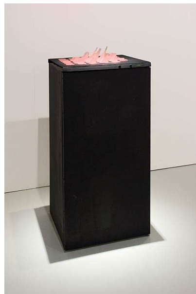
Juan Luís Moraza, Base específica (estatua al monumento) , 1994