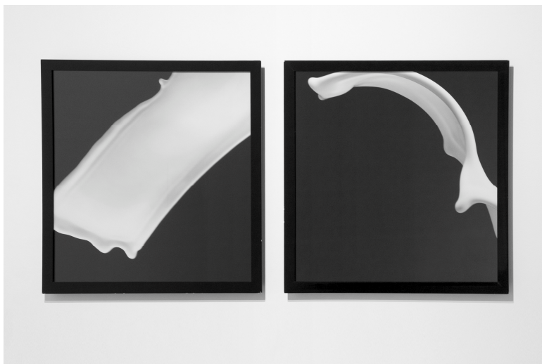
Concha Prada, Leche derramada III , i Leche derramada V , 1999