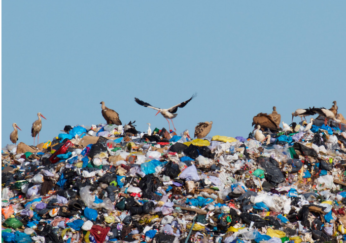
Marc Gálvez, Cigüeñas, buitres y garcillas bueyeras en el vertedero de Montoliu de Lleida , 2018. Fotografía.

Un mundo condicionado por el cambio climático, la pérdida de biodiversidad, la degradación de los ecosistemas, las pandemias víricas, el aumento de la vulnerabilidad y de las desigualdades, y el auge de la violencia basada en el sexo, la raza y el género, hace necesario repensar la convivencia entre humanos y entre especies.